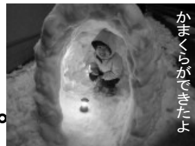
かまくらができたよ