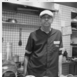
ドライブの5つ星ホテルで6年修行ののち、日本でも7年のホテル勤め。自分のリゾートホテル実現へ スバさん