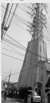
鉄塔がスカートはいているみたい。

吉祥寺駅ホームのエスカレーターの向きが、七月1日 から、上り下りの向きが入れ替わりました。