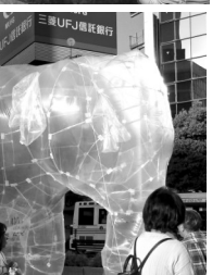
5日は近づけなかった人気ののはな子像。下は、バルーン。下の小さい像が立体設計図。