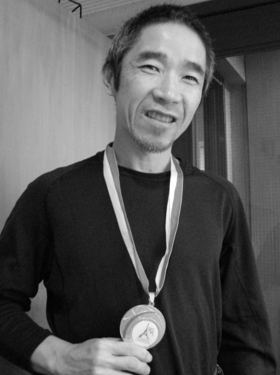
フランス大会二連覇の金メダル

「これから先どうするか。でも焦つても仕方がない。それなら何か役に立つことがしたい」と考えていたとき、アメリカで、全盲でエベレストに登頂した人がいると聞き、しかも自分と同じ年。視覚障害でも自分が思っているよりもっと出来ることがあるのではないかと気づき、会いにいきました。アメ