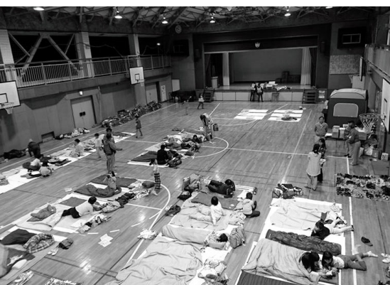
50名宿泊。避難所となったとき何人寝られるかとか、高齢者や障害者の場所はどこにとか、考える手始め。

外環地上部街路話し合いの会中間まとめ作成の作業」が、市民5名と都担当者3名で、話し合いの会の司会者立会いのもと、二カ月に3回ペースで行われています。記録は、時系列(都か、解りやすいテーマ)と(住民)かの綱引きです。会の運営(司会者、都構成員の立ち位置、議事録作成要求)と、外環の2計画の経緯、結果が計画廃止もある4案か都パンプの3案かの議論は入りそう。三月完成目標は延びそうです。九浦も今後に備え、全議事録、資料の完全ファイルを作成中。