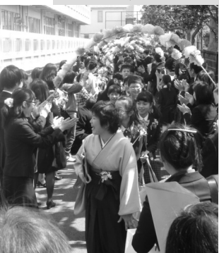
久しぶり青空の下本宿小花アーチ

◎25日第四小と本宿小の卒業式は、久しぶりに快晴の卒業式。本宿小は一昨年の60周年、昨年の防災教育研究発表を担った生徒たちニクラス55名。すつかり大入り、咲き揃ったコブシのように清々しい卒業生でした。第四小はニクラス59名卒業。両校とも、久しぶりに校庭の花のアーチで送り出されました。