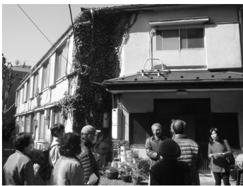
3月23日九浦の家の「街並ウォッチング」は、島原学生寮からスタート

東町二丁目45の東京女子大学側に長崎県島原市の学生寮があります。この寮が三月末で閉鎖されることになりました。この寮は昭和16年、太平洋戦争下、加速する中島飛行機武蔵製作所での作業に従事する女工宿所と