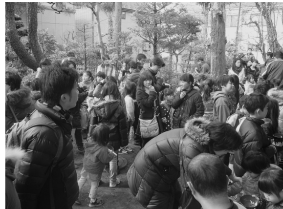
おもちつきに参加者であふれる九浦の庭