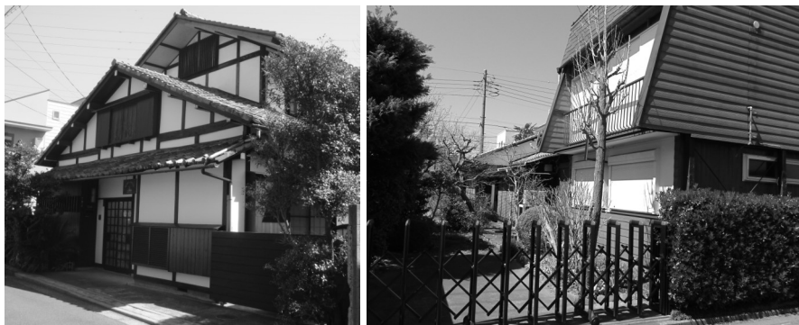
左回りに 丸山真男邸 竹内好邸 三雲祥之助邸 中川紀元邸あと下は東十一小路の農園

画家中川紀元さんが住んでいました。アトリエはもうありません。北宮本小路一本西には、丸山真男と親交があった中国文学、魯迅研究、評論の竹内好氏。二丁目の若い地番にも、文化人が多数住んでおられました。