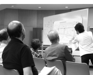
↑ 家屋調査についての情報交換がメインでした。

定年後の、自他とも楽しませる生き方のお手本みたいな先生です。最終講のあと贈られた花束と、大竹英雄名誉棋聖自筆署名入りの本を手に入れた。