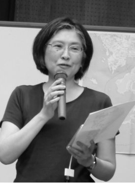
2時間立ちっぱなし。早口で、意表を突く話題を次々に繰り出し、知的好奇心を満たすすごい時間でした。

今回講演の資料・データは九浦の窓口にあります。講演録はスタッフによるまとめが終わった後にご覧いただけます。