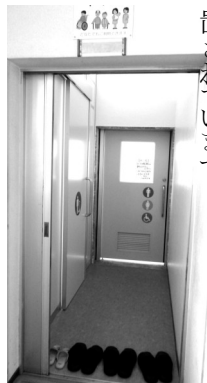
正面ファミリートイレ。左男性用にも扉

▼二月2日から20日まで休館してトイレを大改装。希望した男女位置の入替は無理でしたが、同室のためご不自由かけていたファミリートイレと男性トイレ部分が仕切られました。女性用も洋式二基となり、壁や床が明るくなりました。ファミリートイレはおむつ替えの台と、オストメイトが設置されています。