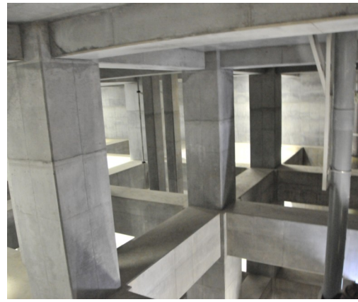
これはまだ地面に近い所。明かりとりの光が届いている

二月一日、やっと完成した下水道合流改善施設Ⅱ大貯留槽の見学会があり、三年にわたる下水道施設建設協議会、工事連絡会など関係者と近隣の方37名が参加。また、7日には市報をみて応募した51名が見学しました。一度汚水が入ったら空になっても一般人は入れないので、内部はこの機会しか見られません。地下30数メートル300トンの貯留槽は、内部に太い柱と梁が何本もあり、また底にゴミや砂などが滞留。しないように溜めた水で一気に流すフラッシュ装置があつて、皆さん予想より中は小さい印象を持たれたようです。階段と壁の隙間が上に行くほど広くなるのは強度と壁の厚さを計算しての結果だそうですが、底から地上の機械室まで30m強上がるのに息切れしました。 1日の見学時は底の釜(水が最後に溜るへこみ)付近に水を見ましたが、7日の見学者は、かなり広範囲に30cmほど透き通った水が溜まっており、質問したら、これだけ深くなると圧で厚いコンクリート壁から地下水が滲み出してくると説明されたそうです。もともと不用な照明は設置してないので懐中電灯頼り、写真を撮るには足場も悪く、うまく伝わるでしょうか。大貯留槽の上「吉祥寺東町ふれあい公園」と法政プール跡地「そよ風緑地」が突貫工事で三月末ほぼ完成。四月初め近隣にはお知らせをポスティング、開園式は、四月18日の予定です。