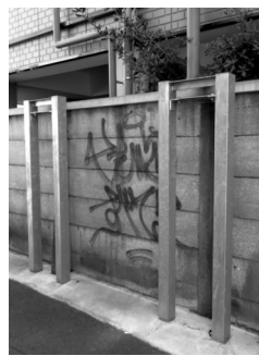
万年塀を、鉄のアームが抱える格好

落書きは予想より少なく、細め控えてありますがありました。万年塀の地震対策の補強の例もありました。壊れても、道に倒れ込むことはないでしょう。この写真の落書きは古いタイプです。