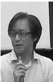
アジアを知ろう台湾編6