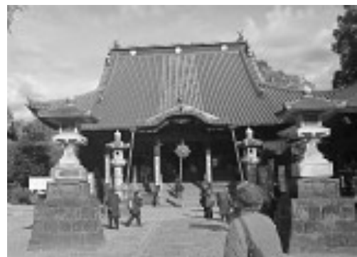
↓ワインの試飲 ↑ 国宝鑊阿寺本堂

「故宮問題は、美術品が素晴らしいという話で終わらない。日中、台湾の歴史は故宮を通して理解し易く、アジアの歴史が分かる。二つの故宮は故宮問題の本質を物語る。台北と北京に同名の博物館が二つ、展示内容も中華のみと同じなのに並立しているとは何なのか。この疑問から私の故宮は始まった」