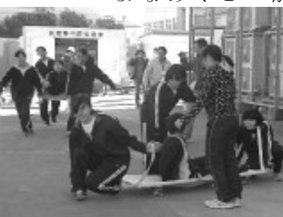
女子生徒が担架組み立てと搬送。さすがにこたえる

備蓄倉庫の用具は、市の担当者も細かいところまでは扱いが分らない物もあつて、いざという時、「それ前にやったことあるから知ってる」という仲間を増やしていくことが最大の身構えになるかもしれません。